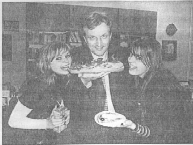
3 Днем Студента! 17 листопада на факультеті – День Бутерброда!