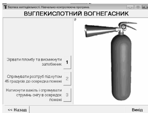
Рис. 2. Тренажер приведення в дію вуглекислотного вогнегасника

студенти мають змогу за допомогою створеного тренажера набути практичних навичок під час приведення різних типів вогнегасників у дію (рис. 2).