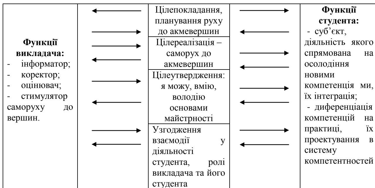
Рис. 2. Властивості суб'єкт-суб'єктних стосунків викладача та студента

Набуті властивості суб'єктів освіти у процесі спілкування, пізнання та праці, пов'язаних із оволодінням компетенціями у процесі роботи над навчальними дисциплінами, навчальною, науковою, технологічною інформацією, що у ній пред'являється, – фізичні, психічні, акмеологічні новоутворення у властивостях індивіда, особистості, суб'єкта діяльності, індивідуальності.