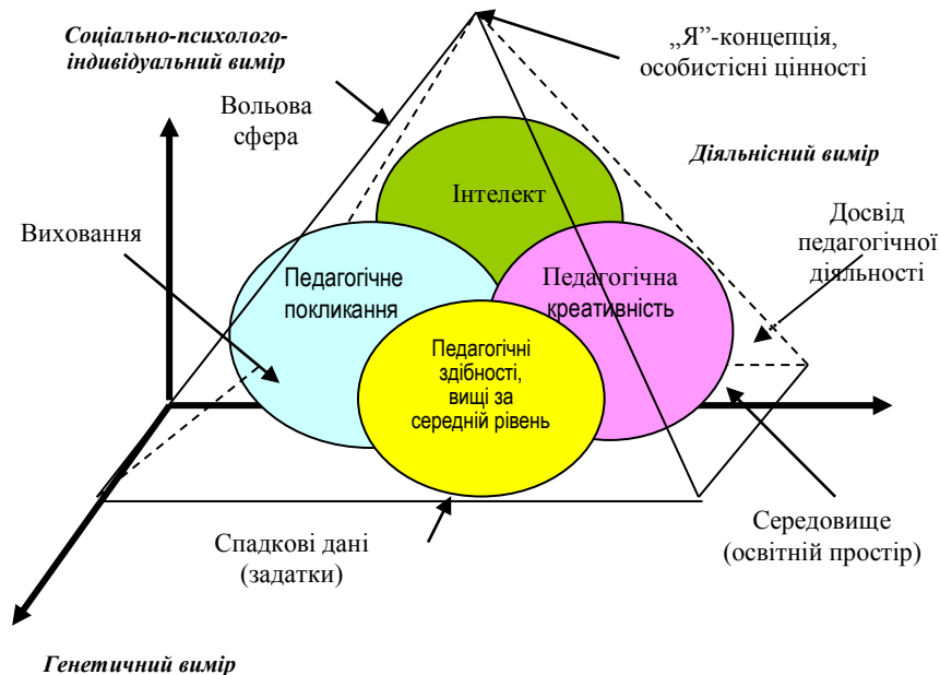
Рис. 2. Модель педагогічної обдарованості (з урахуванням ортогонального підходу до побудови структури особистості В.В. Рибалка)

Зважаючи на результати біографічного аналізу та враховуючи викладені вище міркування щодо сутності та структури обдарованості, основу запропонованої нами моделі педагогічно обдарованої особистості складають такі компоненти: педагогічні здібності , рівень розвитку яких вище за середній; педагогічна креативність , тобто здатність учителя до педагогічної творчості; педагогічне покликання , як спрямованість особистості до виконання педагогічної діяльності; інтелектуальні здібності , як необхідний чинник, що сприяє засвоєнню та трансформації знань у визначеній науковій сфері (див. рис. 2).