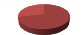
Рис.2.Рівень адаптованості до навчання учнів 5 класу (дівчатка)

У дівчаток-п'ятикласниць показники адаптації, на відміну від хлопчиків, дещо кращі. Так, на діаграмі (Рис.2) в ході дослідження серед опитуваних не виявлено жодної дитини з дезадаптивним рівнем і 29 % дівчаток мали показники неадаптованого рівня шкільної адаптації.