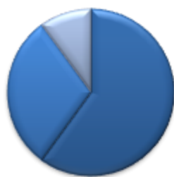
Рис.1.Рівень адаптованості до навчання учнів 5 класу (хлопчики)

Очевидний рівень неадаптованості мали троє хлопчиків, неочевидний рівень зустрічався у чотирьох учнів. Також був виявлений один дезадаптований учень. (див. Рис. 1).