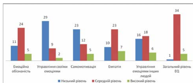
Рис. 3. Рівні прояву складників емоційного інтелекту студентів-випускників спеціальності «Психологія»

Також використана нами методіка дозволила дізнатися рівні прояву складників емоційного інтелекту (рис. 3).