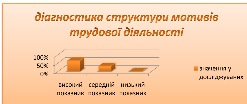
Рис.2. Діагностика структури мотивів трудової діяльності

Таким чином, ми можемо спостерігати за стимулами, винагородами, тобто все те, що приводить до активності військовослужбовців, що є цінним для них. Значимість професії для військовослужбовців займає важливе місце. Про це свідчить кількість відповідей респондентів та отримане відсоткове відношення (див. рис.2.)