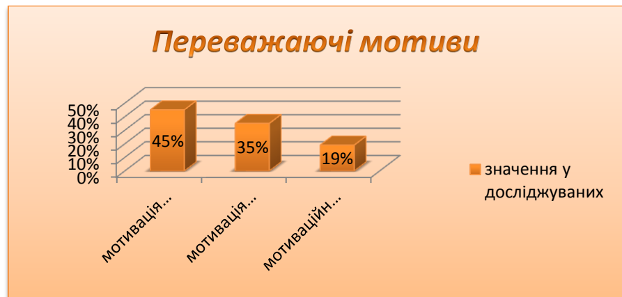
Рис.1. Середні показники отриманих результатів, у відсотковому співвідношенні, за методикою А. А. Реана

Даний рисунок демонструє співвідношення мотивів респондентів у відсотках. За цими результатами ми, можемо зробити висновок, що у більшій частини респондентів переважаючим компонентом є «мотивація успіху». Таким чином ми, можемо говорити про те, що 45% респондентів у яких мотивація успіху воліють задовольнити сильну потребу в досягненнях, покластись на власні сили та самовдосконалюватись, як особистість та професіонал військової справи. Дані респонденти мають схильність працювати над завданнями, які вимагають певної відповідальності, зусиль, але не є нерозв'язними. Від своєї роботи вони отримують більше задоволення тоді, коли самі і самостійно визначають свої цілі, але при цьому не забувають про обов'язки військовослужбовця, які прописані військовим статутом. Дані респонденти завжди хочуть бути на висоті, не тільки перед колегами, а і у повсякденному житті, вони мають високий соціальний статус.