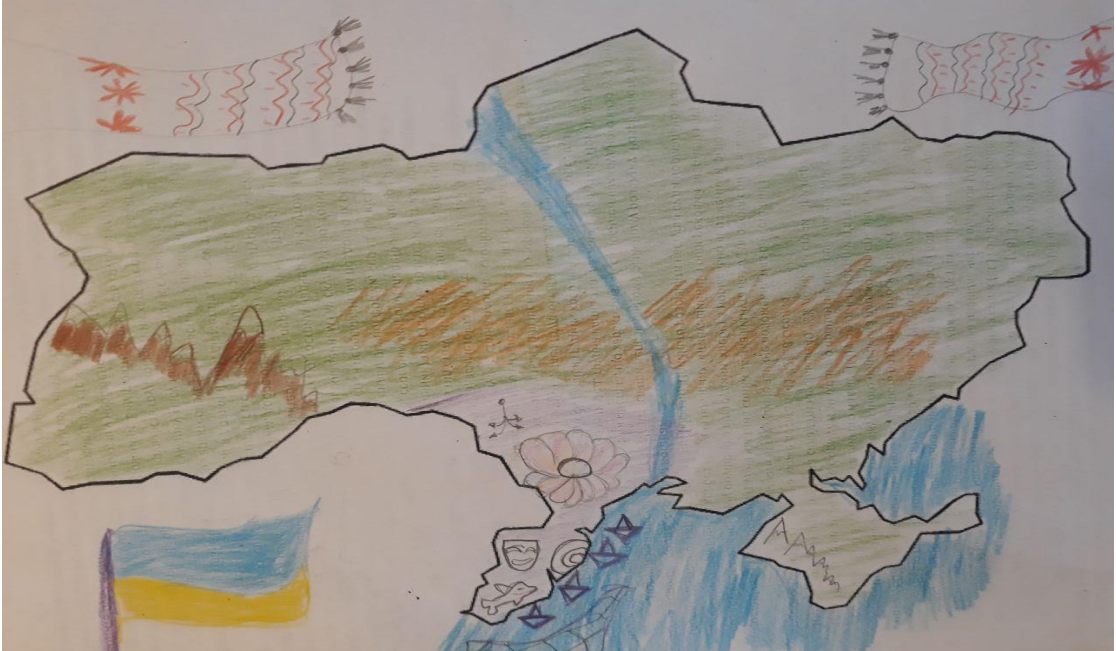
Рис. 4. Малюнок підлітка, який має позитивний образ України (вік досліджуваного – 13 років)