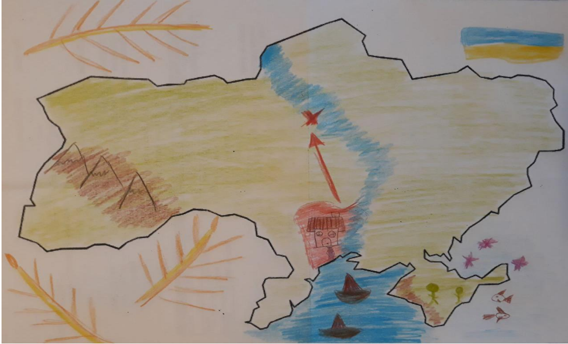
Рис. 3. Малюнок молодшої школярки, яка має позитивний образ України (вік досліджуваної – 8 років)