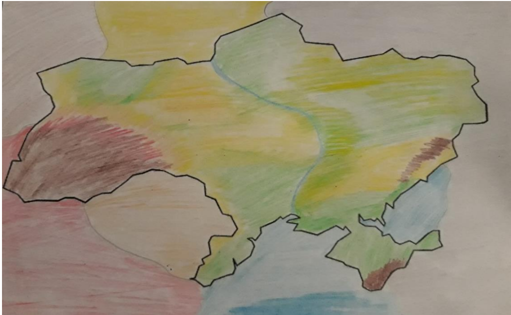
Рис. 3. Малюнок підлітка, який має нейтральний образ України (вік досліджуваного – 14 років, Південний регіон)

Ознаками негативного образу України у свідомості молодших школярів та підлітків є такі характеристики: