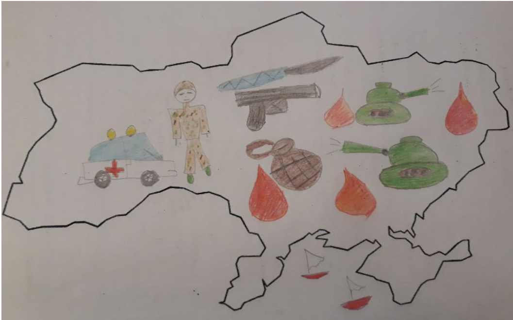
Рис. 4. Малюнок молодшого школяра, який має негативний образ України (вік досліджуваного – 9 років, Східний регіон)

Часто в роботах дітей зустрічаються схожі елементи, але вони мають різні символічні значення. Наприклад, для одних досліджуваних зображення зброї та блискавок – це символічне позначення смутку, неспокою, страху та інших негативних переживань, що пов'язані з військовими діями на Сході України, для інших досліджуваних – це позначення сили, могутності, безпеки, впевненості у захисті українськими військовими. Тож визначення типу образу рідної країни в етнічній свідомості досліджуваних можливе лише за умови комплексного аналізу їх малюнків та вербальних висловлювань.