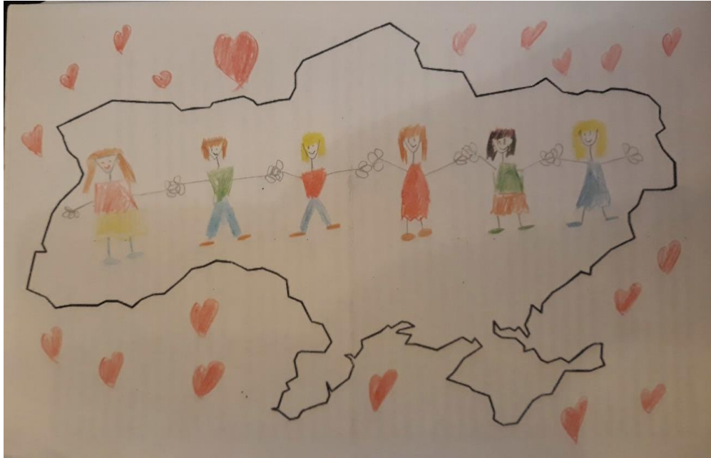
Рис. 2. Малюнок молодшої школярки, яка має позитивний образ України (вік досліджуваної – 6 років, Центральний регіон)

Про нейтральний образ України у свідомості дітей свідчать такі характеристики: