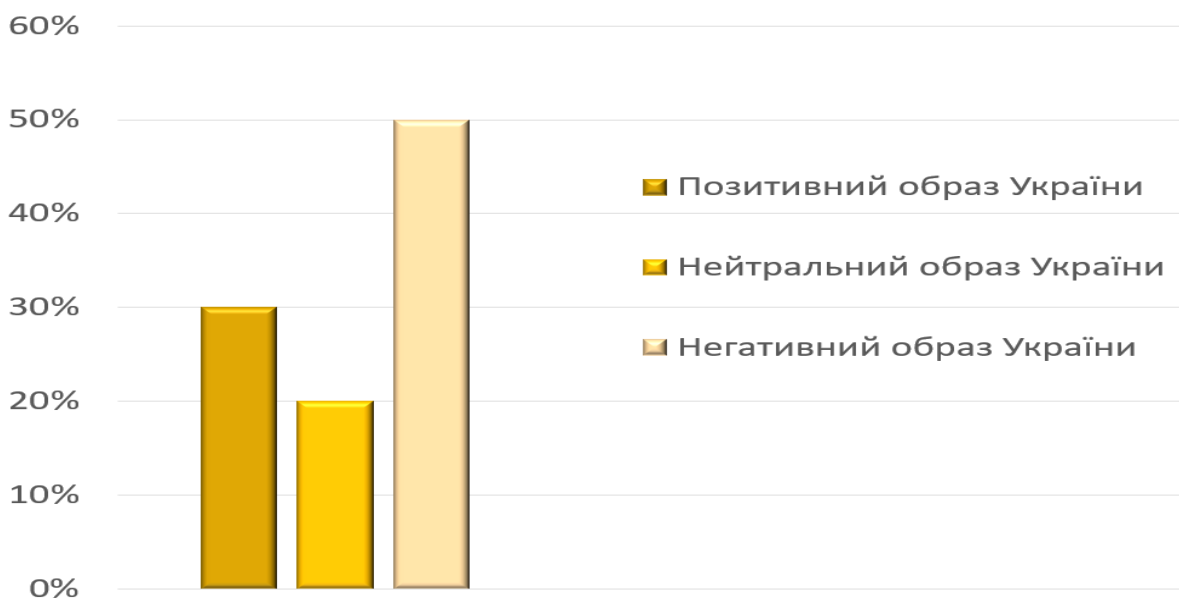
Рис. 1. Типи образу України в етнічній свідомості молодших школярів зі Східного регіону

Виявлено, що лише п'ята частина молодших школярів зі Східного регіону (20%) мають позитивний образ рідної країни. Майже третина дітей (30%) демонструють нейтральний образ України. Половина учнів початкових класів (50%) показують негативний образ країни (рис.1).