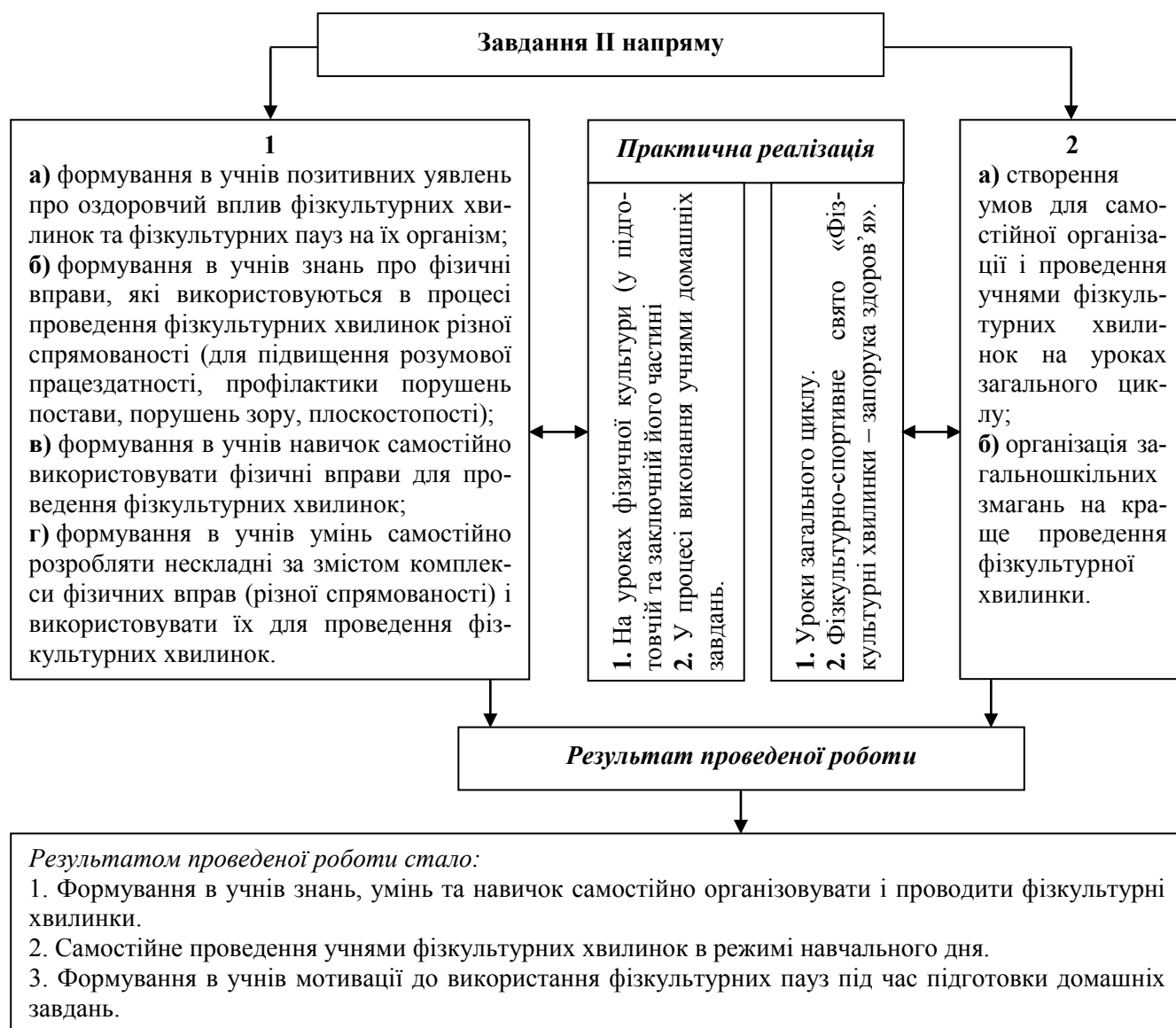
Рис. 2. Другий напрям педагогічної технології