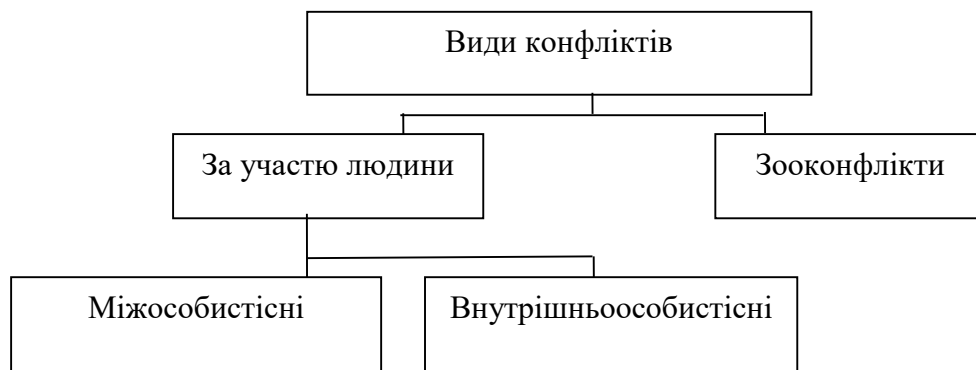
Рис. 3.1. Класифікація конфліктів за А. Я. Анцуповим

Схема – це зображення, що передає основну ідею будь-якого процесу або явища, показує взаємозв'язок його головних елементів за допомогою умовних позначок (рис. 3.1).