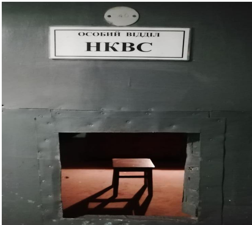
Рис.3. Кімната особового відділу НКВС

Кімната особового відділу НКВС – окрема кімната й охорона належала офіцерам НКВС (народний комісаріат внутрішніх справ), з метою перевірки особового складу військ на відданість комуністичній владі. При кожному корпусі та полку обов'язково був свій відділ НКВС (Рис.3). Всі без виключення дуже боялися потрапити на допит офіцерів НКВС, бо в більшості випадків все закінчувалось трагічно. І звичайно не обійшлося без Сталіна, бо контролювали об'єкт не прості військові, а спеціалізований полк НКВС.