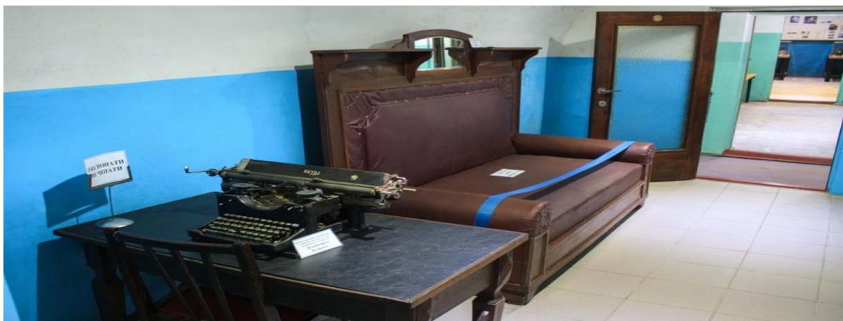
Рис.2. Кімната відпочинку або зал Сталіна

Приголомшує той факт, що «Скеля» і сьогодні здатна витримати удар атомної бомби. Адже товщина стін становить майже 40 метрів. Це унікальна інженерна споруда, якій немає аналогів у світі.[6] На даний час, у підземеллі налічується – 36 кімнат. Інші кімнати були технічними або слугували для бойового чергування. Лише одна кімната була призначена для відпочинку – це кімната Сталіна. В ній були шкіряні дивани, картини, а також дорогі меблі, що дуже дивно для звичайного командного пункту (Рис.2).