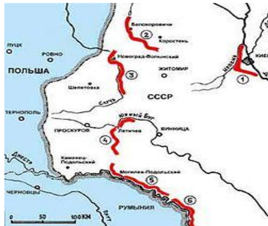
Рис.5. Територія Коростенського укріпленого району

Коростень – це місто, яке свого часу змінило стратегію військових дій Гітлера. У Житомирській області функціонувало два штаби укріплених районів - у Коростені та Новограді-Волинському (Рис. 5) .