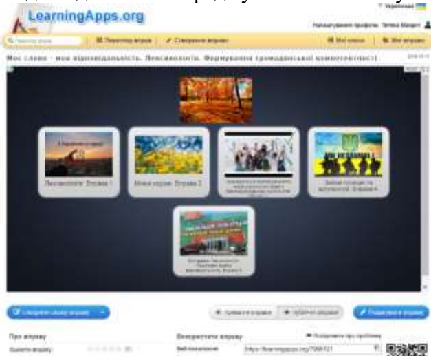
Рисунок 3. Зображення першої сторінки кейсу вправ.

чергою, сприяє розвитку критичного мислення, навичок самоосвіти, організальних умінь, розумінню відповідальності перед суспільством за культуру власного мовлення.