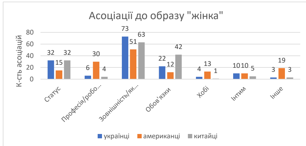
Рис. 3.11. Асоціації до образу «жінка» по категоріям

сексуальна, тендітна, добра; за категорією «Статус» - дружина, мама, сестра, коханка, господиня; за категорією «Обов'язки» - хатні обов'язки, домашні справи, готування їжі, прибирання.