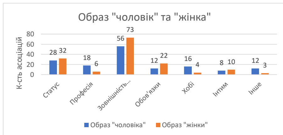
Рис. 1. Асоціації до образу «чоловік» та «жінка» по категоріям (відповіді українців)

Таким чином, чоловіки, і жінки викликають найбільше асоціацій пов'язані зі зовнішніми рисами та якостями особистості (образу «жінки» частіше відносили – жіночність, краса, ніжність, образу «чоловіка» - мужній, сильний, цілеспрямований).