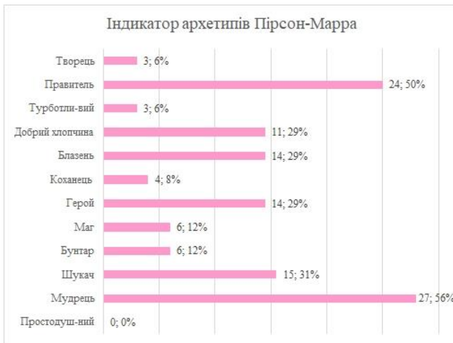
Рис. 3. Характерні для молоді архетипи (за методикою К. Пірсона та Х. Марра)

В контексті даного профілю можна говорити про схильність сучасної молоді до вдумливого ставлення до оточуючого середовища. Теперішнє юнацтво не сліпо вірить, а шукає доказів. І тут криється небезпека – конфлікт ідеалістичних прагнень та неідеального світу. Стикаючись з реальністю, молоді люди дуже швидко набувають дещо цинічного світосприйняття та вкрай неохоче йдуть на зміну свого способу мислення відносно тих чи інших речей. Тут важливого та впливового значення набуває оточення людини – молодість, на щастя, достатньо добре піддається якісним змінам, тому при певних зусиллях цинізм можливо замінити на іронію, що значно полегшує ставлення до життя.