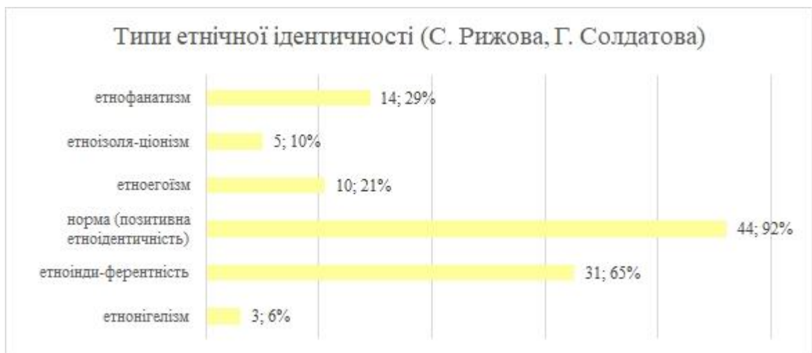
Рис. 2. Типи етнічної ідентичності молоді (за методикою С. Рижової та Г. Солдатової)

Серед архетипів, що визначались за методикою «Індикатор архетипів» (К.Пірсон, Х.Марр), для досліджуваних молодих людей найбільш характерними виявилися два – Мудрець (у 56% опитаних він є переважаючим) та Правитель (переважає у 50%). Як показало дослідження, у однієї людини може переважати не один архетип, а два або кілька (рис. 3).