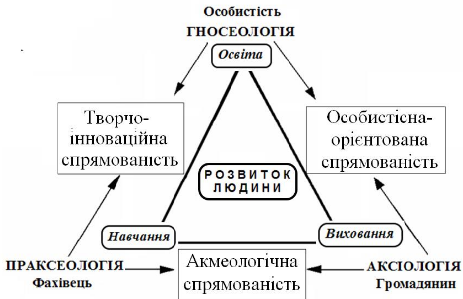
Рис. 2. Системна кореляція головних категорій педагогіки у контексті типів спрямованості педагога

Покажемо системну кореляцію деяких важливих освітньо-педагогічних категорій відповідно до загальної теорії систем та місце у цій систем типів спрямованості викладачів ЗВО.