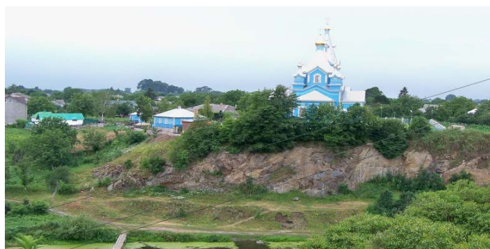
Рис. 3. Заказник геологічний місцевого значення Корецькі граніти

Заказник геологічний місцевого значення Корецькі граніти, розміщений у межах Корецького району Рівненської області, між селом Новий Корець та містом Корець (рис. 3). Його площа – 15 га. Заказник створений із метою збереження гранітних скель на березі річки Корчик. Граніт темно-сірий, складається з кварцу, польового шпату, біотиту, а також тонких прожилок графіту.