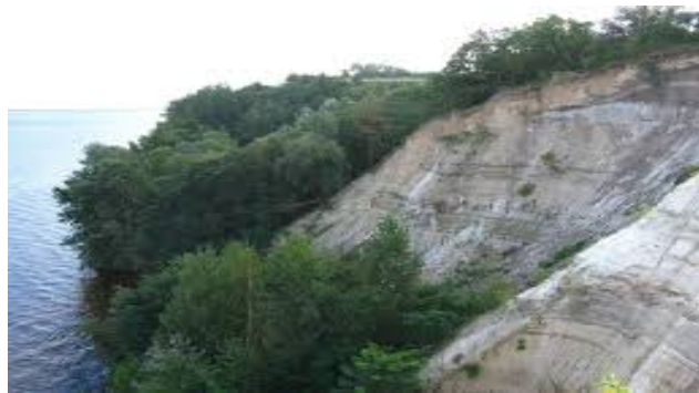
Рис. 2. Пам'ятка природи геологічна місцевого значення Ново-Петрівський геологічний розріз

Заказник геологічний місцевого значення Корецькі граніти, розміщений у межах Корецького району Рівненської області, між селом Новий Корець та містом Корець (рис. 3). Його площа – 15 га. Заказник створений із метою збереження гранітних скель на березі річки Корчик. Граніт темно-сірий, складається з кварцу, польового шпату, біотиту, а також тонких прожилок графіту.