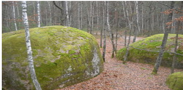
Рис. 1. Заказник геологічний місцевого значення Камінне Село

площу 2 га. На березі Київського водосховища у стіні кар'єру та в яру, що перетинає село, оголюються відклади неогенового та палеогенового віку (рис. 2). Найпотужніший шар становить 50–60 м. Об'єкт має серію різноманітних порід, окрасою яких є пісковик (потужністю 2,5–3 м). Він містить скам'янілі ядра прісноводних пелеципод.