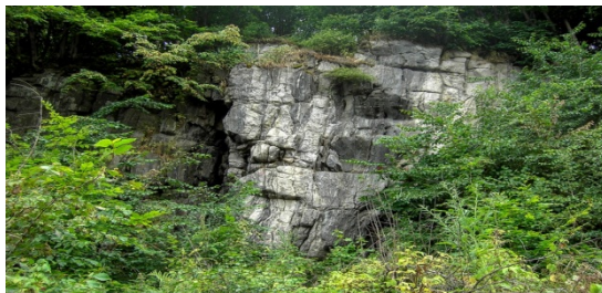
Рис. 4. Заказник геологічний місцевого значення Марининсько-Устянські граніти

Корецького району. Переважають метаморфічні породи, серед яких у вигляді невеликих масивів, лінзоподібних та жильних тіл трапляються породи інтрузивного комплексу. Вони представлені сірими, рожевими, червоними аплітоїдними гранітами та пегматитами. Пегматити генетично пов'язані з апліто-пегматоїдними гранітами.