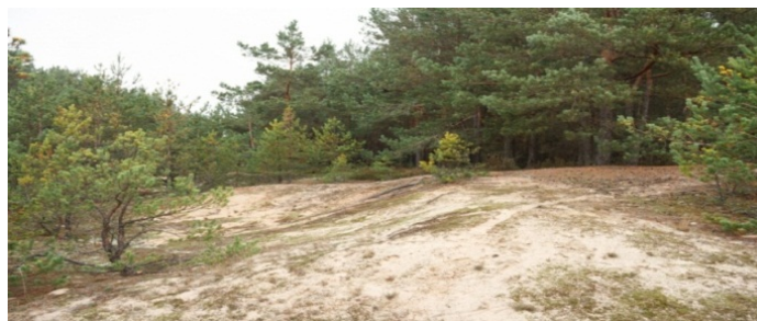
Рис. 5. Заказник геологічний місцевого значення Дюна

Заказник геологічний місцевого значення Дюна розміщений на території Старовижівського району Волинської області, між селами Синове, Буцинь та Сереховичі (біля села Нова Воля) (рис. 5). Площа – 90,1 га. Дюна утворена на Волинському Поліссі в умовах післяльодовикової пустелі в результаті перевіювання з наступною акумуляцією водно-льодовикових середньоплейстоценових пісків зандрової рівнини після дніпровського зледеніння – еолова параболічна дюна.