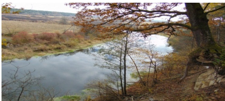
Рис. 6. Пам'ятка природи (комплексна) Горинські Крутосхили

Пам'ятка природи (комплексна) Горинські Крутосхили, розміщена в межах Ківерцівського району Волинської області, на схід від села Яківці й на південь від села Деражне (рис. 6). Площа – 30 га. Статус пам'ятки природи Горинські Крутосхили отримали в 1975 р.