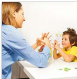
Рис. 4. Врахування особливостей дітей з синдромом Дауна та аутизмом в навчальному процесі

Діти з психічними розладами (епілепсія, діти із гіперкінезами). Діти з таким видом захворювання як епілепсія іноді не можуть згадати, що з ними сталося, вони не розуміють, де вони, що відбувається. Родичі або лікарі зобов'язані повідомляти шкільних медсестер і вчителів про судоми у дитини та пов'язані з цим обмеження.