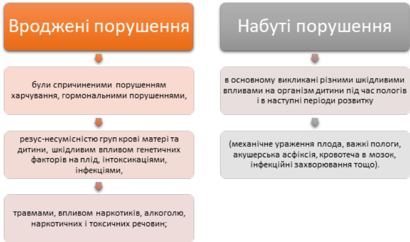
Рис. 3. Порівняльна таблиця вроджених та набутих порушень

Навчання і виховання дітей з вадами психофізичного розвитку здійснюється з урахуванням особливостей їх розвитку, застосування конкретних заходів та організаційних форм виховної роботи залежно від характеру порушення [4].