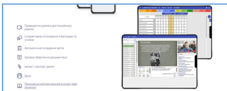
Рис. 2 Додаткові можливості

Перевагою використання даної системи контролю успішності та відвідувань занять є можливості, зазначені на сайті (рис. 2):