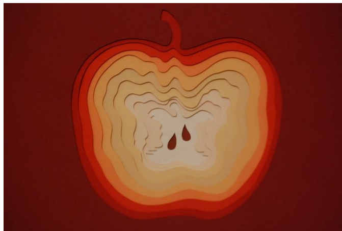
Картина «Яблуко», 2019, Галина Клепиковська (псевдонім: Галина Кисіль)

Сьогодні ми вступаємо в добу постглобалізма, тому що глобалізм, його основні характеристики і напрямки вже сформовані. Так, соціальна дистанція, що існує сьогодні через глобальну пандемію, спричинена наслідками саме глобалізації в умовах життя. І в цих умовах у людства є можливість бути експериментаторами, замислитись над таким питанням як використання позитивного досвіду світового мистецтва, коли мова йде про гармонію та гедонію. Це, можливо, в деякому сенсі – і уповільнення «машини стрімкого прогресу», яка нераціонально спалює невідновлювальні ресурси планети заради прибутку, «споживацтва». А ще це відповідальність в глобальному сенсі. Особисто я вирішила розглянути звичайний пакувальний картон як ресурс для формотворення. Неймовірна кількість цього матеріалу недооцінюється і просто спалюється (в кращому випадку). Вивчаючи це питання, я виявила, що першим, хто звернувся до ідеї використання картону як вторинної сировини в дизайні меблів був Френк Гері, видатний сучасний архітектор і дизайнер меблів. Ще в 60-х роках 20-го століття він створив концепцію меблів з картону, і сьогодні його вироби зберігаються в музеї Метрополітен у Нью-Йорку. Через пластичність картону, його доступність і можливість легкої обробки і подальшої утилізації він являє собою унікальну сировину, з якої можна створити стійкі і жорсткі конструкції з мінімумом витрат. Сьогодні такі корпорації як «Нордверк Дизайн» виявляють дива формотворення і необмеженість в реалізації найсміливіших ідей.