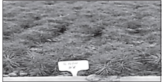
Рис. 5. Загальний вигляд сіянців сосни звичайної, оброблених у 2-х кратній повторності розчином 5% Епіну (Агріфлекс)