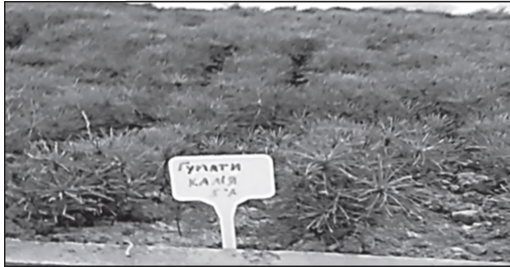
Рис. 4. Сіянци сосни звичайної, оброблені 5% розчином гуматів калію у теплиці «Соболівського лісництва» ДП «Романівський лісгосп АПК»