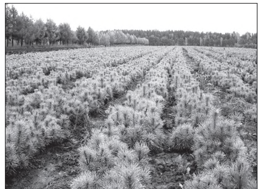
Рис. 2. Сучасний стан лісів України і лісовідтворення, європейський досвід