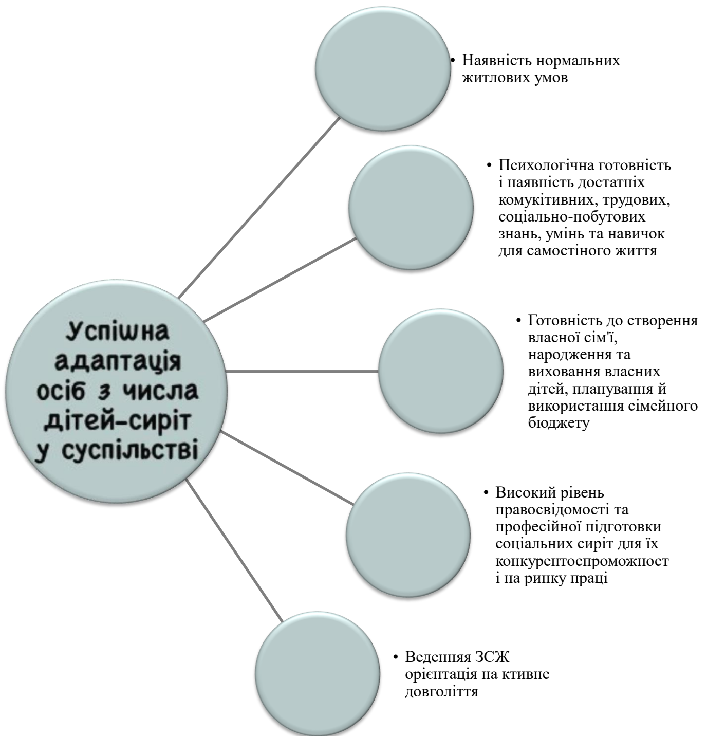
Додаток Б – Складові успішної соціальної адаптації осіб з числа дітей-сиріт та дітей, позбавлених батьківського піклування у суспільстві