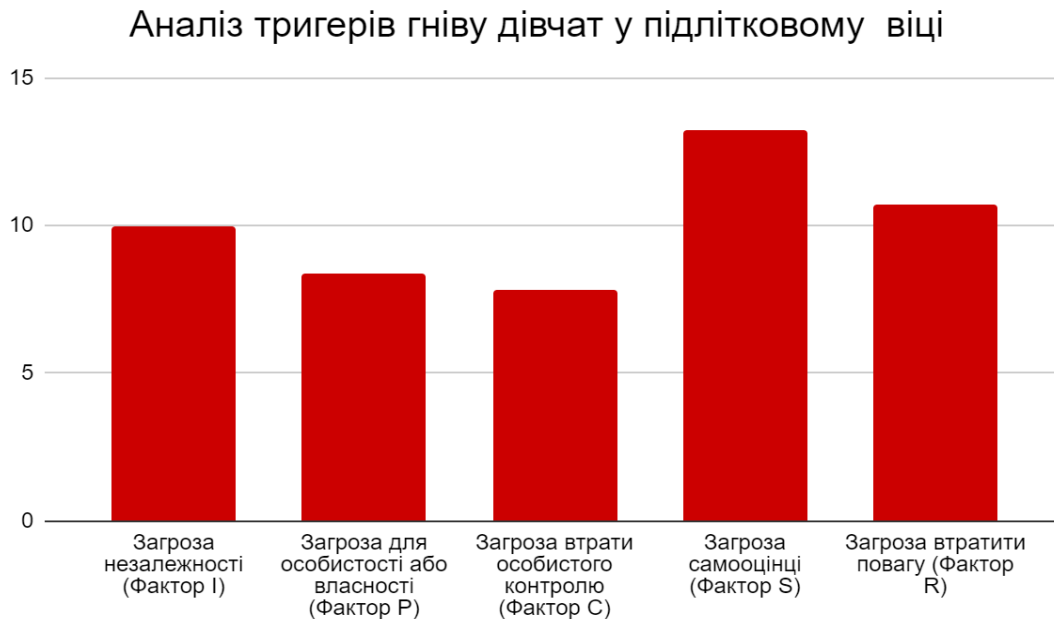
Рис. 1. Аналіз тригерів гніву у дівчат

Аналізуючи отримані в ході дослідження дані за всіма факторами, можна говорити про те, що в дівчат найменше викликають гнів чинники, які описані в межах факторів «Загроза втрати особистого контролю» та «Загроза для особистості або власності» (7,8 та 8,4 балів відповідно) (Рис.1.1).