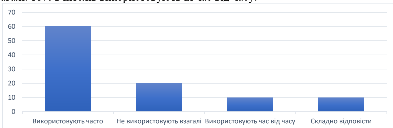
Рис.1 Рівень застосування інтерактивних плакатів у освітньому процесі

Об'єднання аудіо та візуальних засобів забезпечує можливість одночасного розвитку вмінь та навичок учнів, сприяє розвитку комунікативної компетенції тощо. Саме тому їх використання у навчальному процесі не варто недооцінювати. Для перевірки рівня застосування інтерактивних плакатів було проведено опитування серед учнів та вчителів Глибочицького ліцею. Нижче наведемо діаграму з обчисленими та інтерпретованими даними (рис. 1). На діаграмі вказано, що 60% опитаних вчителів часто застосовують інтерактивні плакати у своїй діяльності. Натомість 20% не використовують інтерактивний плакат як засіб унаочнення взагалі. 10% вчителів використовують їх час від часу.