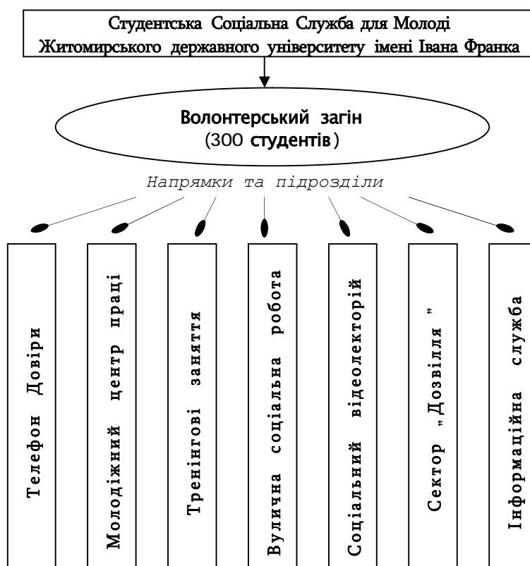
Основні напрямки роботи та завдання діяльності СССМ