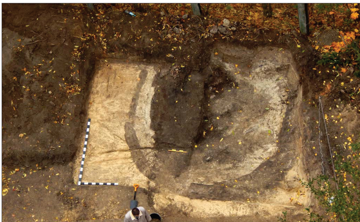
Рис. 1. Об'єкт 1 у північно-східній частині розкопу, вид зверху

хіву, на вільній від забудови і дерев ділянці було закладено розкоп. За допомогою важкої техніки розкрито порушений внаслідок будівництва поверхневий шар ґрунту, здійснено зачистку поверхні. Під час розкопок на ділянці розкопу, на фоні материкового темно-жовтого лесового ґрунту, зафіксовані