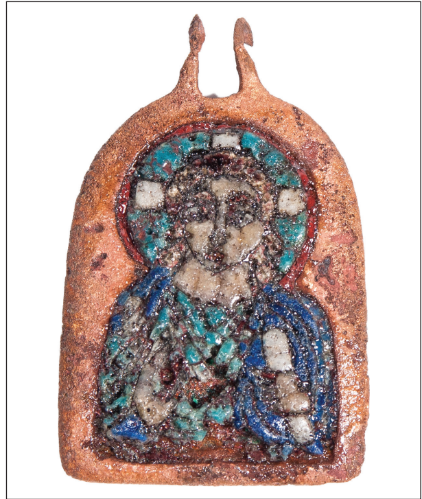
Рис. 3. Мідний образок-іконка з вставками емалі різного кольору

Особливий інтерес представляє доволі велика споруда, виявлена у північно-східній частині розкопу. На фоні темно-жовтого лесу вона виділяється темною плямою округлої форми, приблизним зовнішнім діаметром 5,35 м. У поверхневому шарі заповнення було виявлено багато кісток тварин і уламків глиняного посуду, які попередньо можна датувати у межах VIII – IX ст., X – першої половини XIII ст., другої половини XIII – XV ст. та XVI – XVIII ст. Об'єкт є оборонною спорудою доби розвинутого або пізнього середньовіччя типу вежі. В актових документах, в яких описується житомирський замок у середині XVI ст., згадується одна із веж, що мала назву «кругла» (рис. 1, 2).