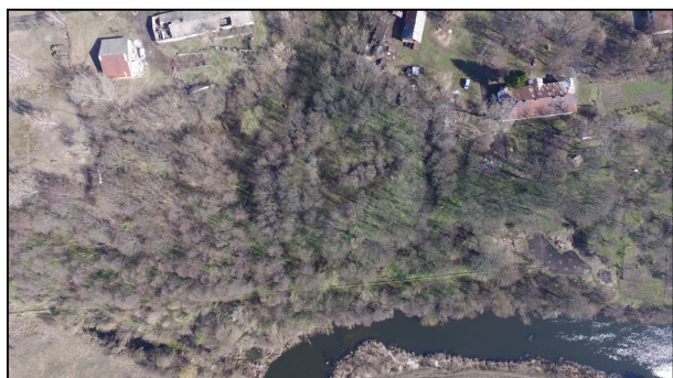
Рис. 1. Фото Малинського городища з квадрокоптера