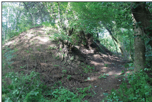
Рис. 2. Вид розриву центральної частини валу із заходу та сходу