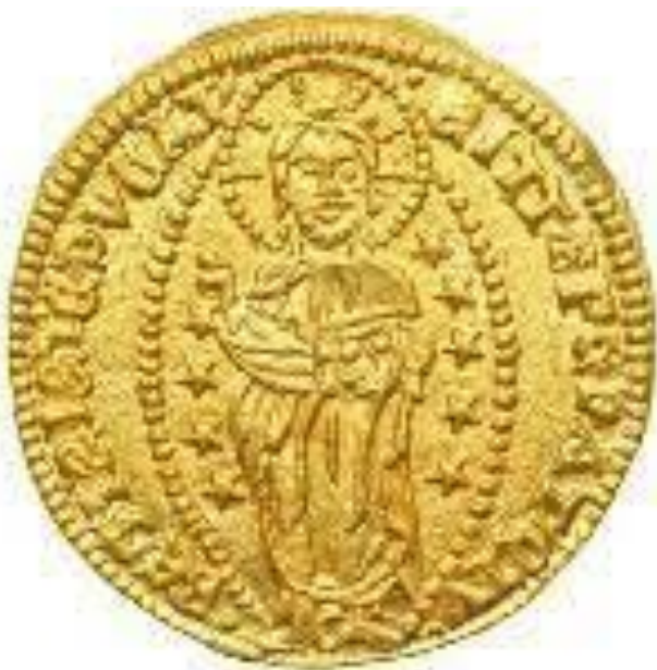
ДУКАТ DVСАТ (Хай буде твоїм Христосе герцогство, яким ти правиш)