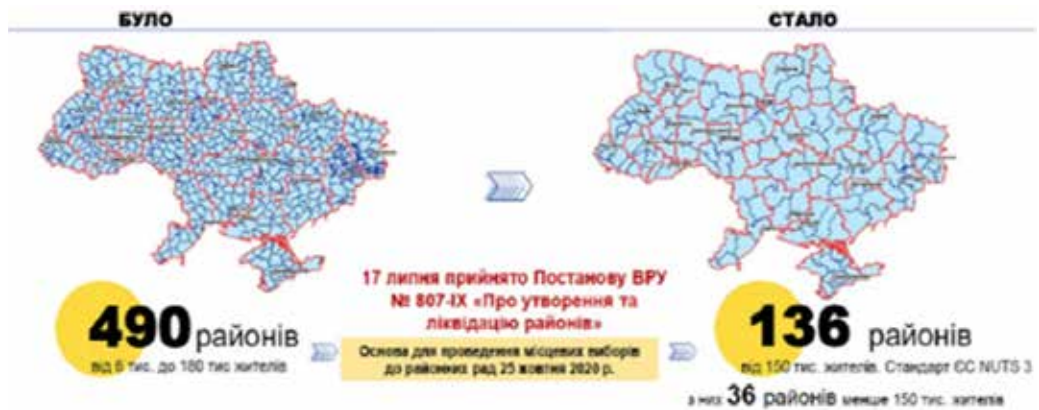
Рис. 1. Система адміністративно-територіального устрою України

в адміністративний спосіб, передбачений Постановою Верховної Ради України було визначено 1469 територіальних громад у складі нових районів, при цьому частину дрібних громад, утворених на добровільних засадах, було ліквідовано. Розроблено систему показників спроможності територіальних громад (демографія, інфраструктурний розвиток, фінансове забезпечення), моніторинг й аналіз яких дозволять визначити потенціал кожної громади та оцінити набутий нею рівень розвитку. На сьогодні зафіксовано, що кращі результати фінансово-економічного розвитку мають великі (укрупнені) ТГ, тоді як менші – не мають змоги ефективно функціонувати без дотацій.