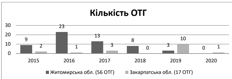
Рис. 3. Кількість утворених ОТГ в Житомирській та Закарпатській областях

Кількісну характеристику нового адміністративно-територіального устрою України у розрізі областей відображено в таблиці 1 створеній на основі опрацювання статистичних даних [5]. Проте відкритим залишається питання проведення заключного етапу