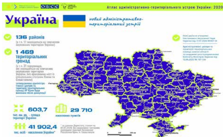
Рис. 4. Новий адміністративно-територіальний устрій України