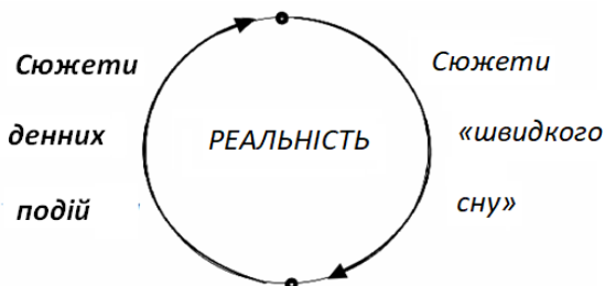
Рис. 1. Циклічний реципроктний (взаємний) вплив сюжетів швидкого сну та денних подій

Звідси можна дійти висновку, що образно-метафоричний аспект соціальної дійсності, відображений у релігії, мистецтві, видовищних формах соціуму відіграє роль програматора поведінки як окремих людей, так і великих мас людей.