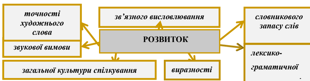
Рис. 1. Розвиток культури мовлення через казку

Дошкільникові легше сприймати навколишній світ через казку, адже її мова проста й доступна, сюжет прозорий і водночас загадковий. Казкові герої чудово вписуються у чарівний світ дитячої фантазії. Безсумнівним є і виховний вплив казки на малят. Твори цього жанру демонструють дітям моделі правильної та адекватної поведінки в різних життєвих ситуаціях, уникаючи зайвого моралізаторства та нудних настанов. Карколомна зміна подій, напруженість сюжету, захоплююча інтрига викликає в малят стійкий інтерес до такої жанрової форми. Крім того, казка формує в дошкільників моральні поняття, розвиває виразність мовлення, лексико-граматичну правильність, звукову вимову, зв'язність висловлювання, загальну культуру спілкування, точність художнього слова та словниковий запас [4, с. 11].