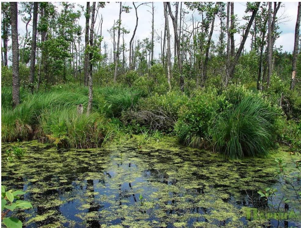
Рис. 2. Рівненський природний заповідник [5]

Заповідник представлено всіма типами боліт українського Полісся: переброди, сира Погоня, сомине, білоозерська. Рослинність дуже різноманітна і свого часу сформувалася в результаті діяльності льодовика. Це реліктові види шейхцерії болотної, хамедафни чашечкової, молодильника озерного, верб лапландської і чорничної, хари витонченої та інших (рис. 2).