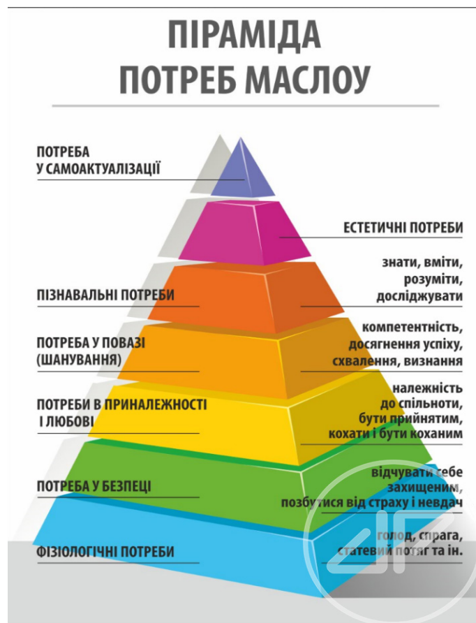
Рис. 3. Ієрархія потреб Маслоу

• Четвертий блок. Структура людського суспільства. Продовження і розширення попередньої тематики. Використовуючи набуті в процесі навчання історико-географічні знання, телемедійну інформацію, власний досвід і спостереження, скласти соціальну структуру суспільства різних історичних періодів на різних територіях, різних народностей. Прослідкувати історичні зміни в складі структур. Скласти їх ієрархію за ступенем пріоритетності, важливості на кожному етапі. Виокремити функції кожної. Порівняти. Дати оцінку. Розраховано на 3 заняття.