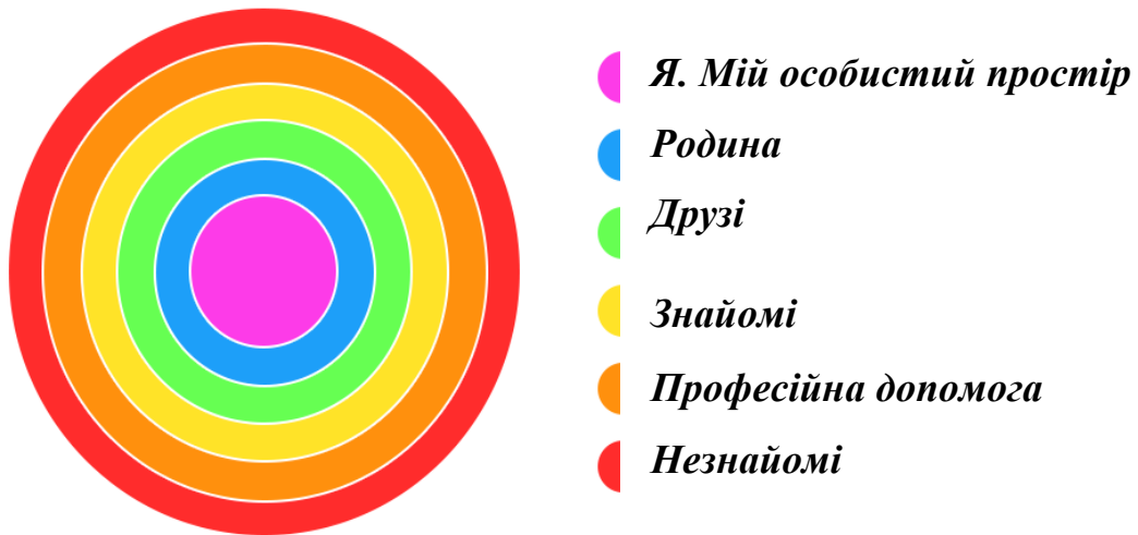
Рис. 1. «Кола спілкування» (соціальні кола)

• Другий блок. «Коло життя» (рис. 2). Завдання цього блоку - окреслити сфери діяльності в житті людини. Спочатку навчити розмежуванню таких понять, як робота, відпочинок, навчання тощо, підштовхнути до розуміння, що кожен крок, дію чи бездіяльність можна віднести до відповідної категорії. Потім визначити ієрархічність відповідних сфер. Розробці теми присвячено 2 заняття.