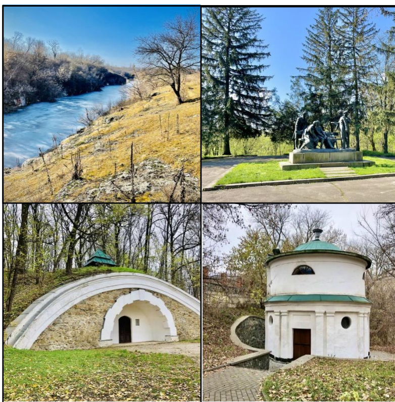
Рис. 1. Туристичні об'єкти міста Кам'янка: А – Тясминський каньйон, Б – Парк Декабристів, В – Грот Декабристів; Г – Зелений млинок.

У 2019 році в Кам'янці було відкрито Алею дружби міст України з 280 саджанців дерев японської вишні Kanzan. Її довжина становить 850 м. Загалом висаджено 280 дерев сакури. Вздовж алеї облаштовані місця для відпочинку. Ця одна з найбільших алей в Україні як по довжині, так і по кількості висаджених дерев. Алея є однією із родзинок Кам'янки [5].