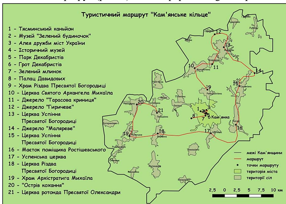
Рис. 2. Карто-схема маршруту «Кам'янське кільце».

Для приваблення туристів до унікальних об'єктів та пам'яток Кам'янщини ми пропонуємо розробку маршруту «Кам'янське кільце» з відповідною карто-схемою (рис. 2). Маршрут створений для урізноманітнення перебування туристів в Кам'янському краю та ознайомлення їх з історією, природою та культурою цього неймовірного куточку України. Для зручності туристів було розроблено онлайн-маршрут (рис. 3) на платформі Google-maps.