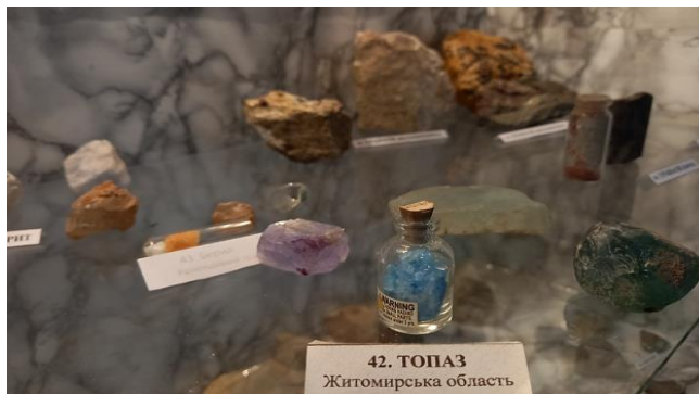
Рис. 2. Колекція мінералів у музеї

з Кольського півострова, унікальні колекційні зразки фіолетового та рожевого кварцу, оніксу, уральський малахіт, дуже рідкісний мінерал керіт, лабрадорит та «живе срібло» з США, цікаві палеонтологічні зразки белемнітів.