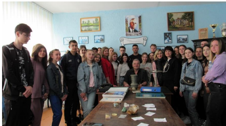
Рис. 3. Співпраця з кафедрою екології та географії Житомирського державного університету імені Івана Франка

Музей продовжує підтримувати зв'язки з Інститутом геології НАН України, Мінералогічним музеєм Львівського Національного університету імені Івана Франка, Житомирським державним університетом імені Івана Франка (рис. 3). У рамках співпраці музей відвідували провідні спеціалісти цих наукових закладів, виступали перед учнями старших класів з лекціями на різну тематику. Найбільше запам'яталися учням зустрічі та спілкування з учасниками Антарктичних експедицій на станцію Вернадського у березні 2018 року. Наша співпраця є надзвичайно результативною: фонди музею постійно поповнюються унікальними зразками мінералів, працівники музею завжди радо співпрацюють з нами, надають ґрунтовні консультації, сприяють розвитку геологічної науки.