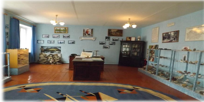
Рис. 1. Меморіально-мінералогічний музей імені академіка В.Г.Бондарчука в Денишівському ліцеї

Осередком краєзнавчої роботи у Денишівському ліцеї є Меморіально-мінералогічний музей В.Г. Бондарчука, що функціонує з 29 жовтня 1997 року, коли Денишівська ЗОШ I-III ступенів відзначала 100-річчя з дня заснування та присвоєння школі імені академіка В.Г. Бондарчука (рис. 1). Червону стрічку до музею перерізав член-кореспондент НАН України О.М. Маринич, першими екскурсантами музею були вчені-академіки НАН України, учні В.Г. Бондарчука (Гожик П.Ф., Митропольський В.П., Шевченко Г.І.), а також представники Житомирської ОДА, Житомирської РДА, обласного та районного відділів освіти, представники місцевої влади.