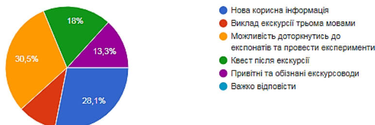
Рис. 5. Діаграма розподілу відповідей респондентів на поставлене запитання