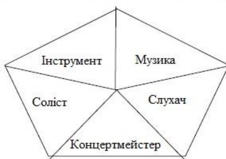
Рис. 2. Суб'єкти та об'єкти відносин у концертмейстерській діяльності

Вищевикладене дозволяє зробити висновок, що до основних видів (і в той же час функцій) діяльності концертмейстера слід віднести художню й педагогічну, а до векторів взаємодії – відносини із солістом, слухачем, музичним твором та інструментом. Так як функції виникають у процесі взаємодії суб'єкта й об'єкта відносин, необхідно побудувати структуру цих відносин. Її ми представимо у вигляді п'яти сторін єдиного художнього цілого, що тісно взаємодіють одна з одною - рис. 2.