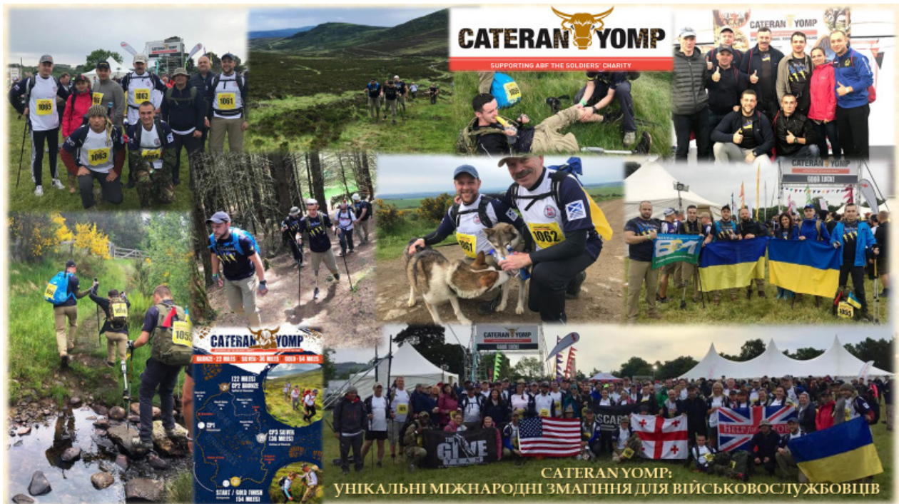
Рис. 2. “Cateran Yomp” — інформаційно-пропагандистський та реабілітаційний захід для військовослужбовців із наслідками бойової травми

Проект “Invictus Game’s”, як різновид змагань з адаптивних видів спорту, був запропонований у 2013 р. для реабілітації та соціальної адаптації військовослужбовців із наслідками бойової травми або травми (захворювання), яке виникло внаслідок виконання завдань за призначенням. Відзначимо, що з 2017 року військовослужбовці України офіційно беруть участь у цих змаганнях.