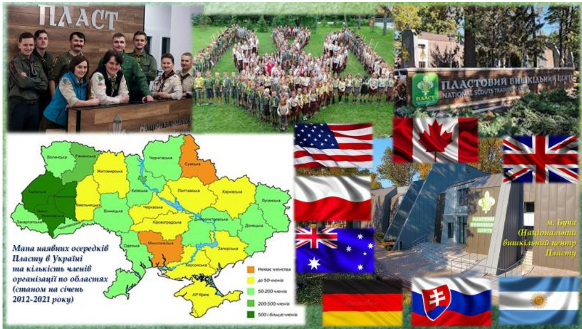
Рисунок 1. Розповсюдженість організації Пласт в Україні та світі (станом на 2021 р.)