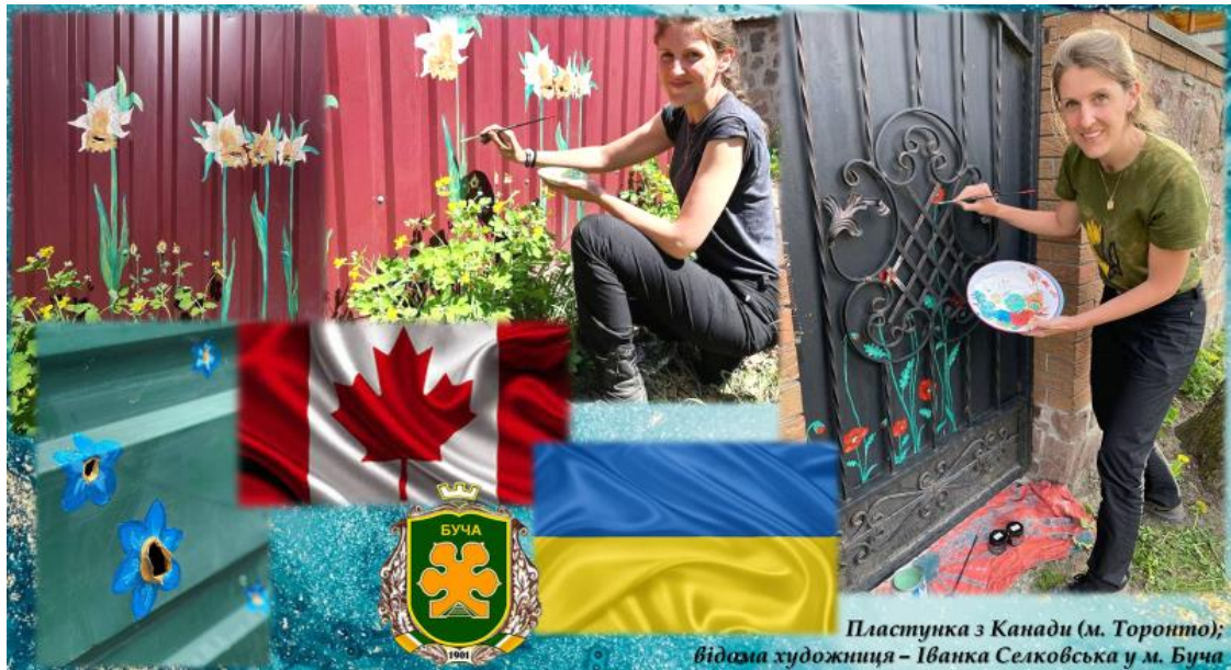
Рисунок 5 – Практична діяльність пластуників під час активних бойових дій в Україні

разом із маленькою помічницею перетворили «порянені» огорожі на квіти, змінюючи настрій та емоції городян [233, с. 398] (рис. 5). Жінка вважає, що це безпосередньо практична реабілітація арт-терапією, і підкреслює, що це також активний фізичний рух. На її думку, саме рух, жага до нового – рухає світом, сприяє відродженню та відновленню духа і тіла.