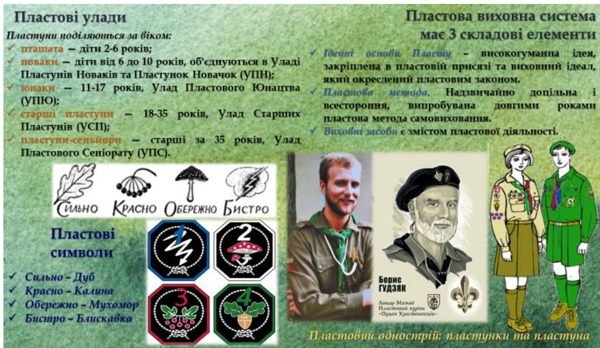
Рисунок 3 – Вікові особливості розподілу учасників Пласту; виховна система і символіка