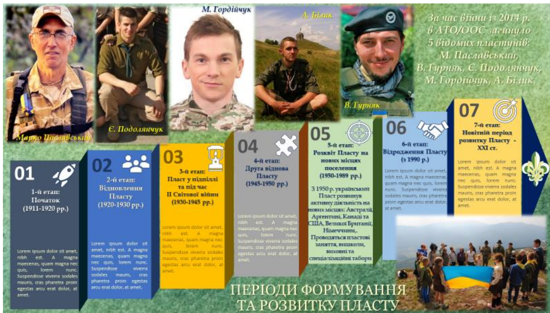
Рисунок 6. Періоди розвитку Пласту в Україні та відомі пластуни – герої АТО / ООС

О. Юденко та М. Сербін [233, с. 398] підкреслюють, що «окрема сторніка болю цієї безжальної війни – загиблі «Воїни світла» у найпекельніших точках фронту під Києвом, на Донеччині та Луганщині, Харківщині, Херсонщині».