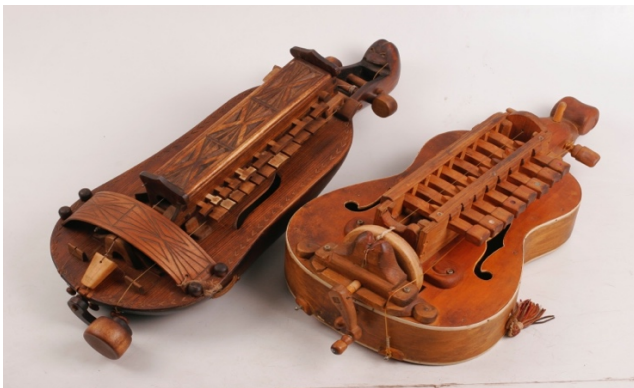
Ліра Кобза Бандура Торбан