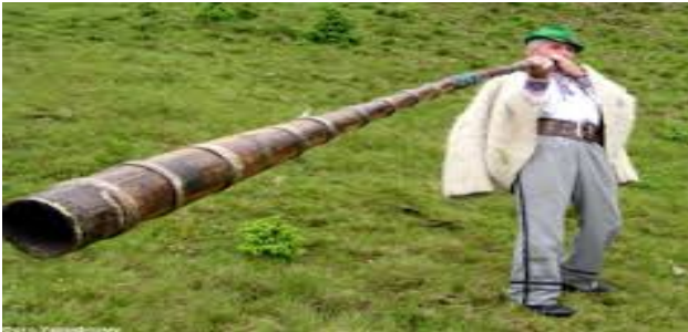
Трембіта Труба Ріжок Сурма