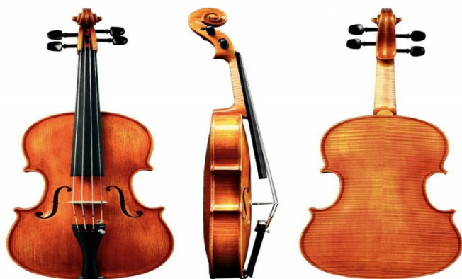
Скрипка Кобза Ліра Торбан

Назвіть, який ударний український народний інструмент зображено на фото: