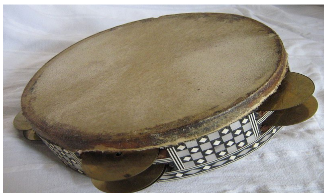
Бубон Калатало Рапач Тарілка