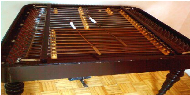
Басоля Гуслі Цитра Цимбали