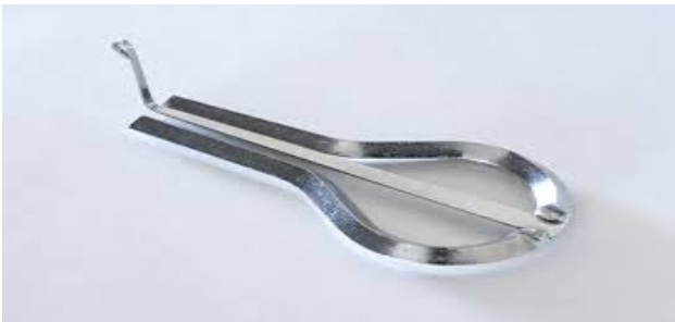
Свистунець Дримба Сопілка Зозулка

Назвіть, який струнний український народний інструмент зображено на фото: