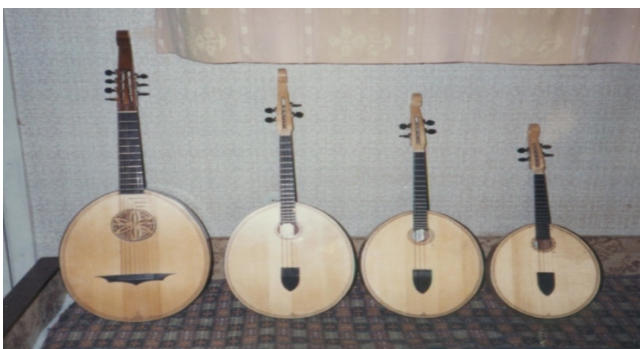
Кобза Ліра Торбан Домра