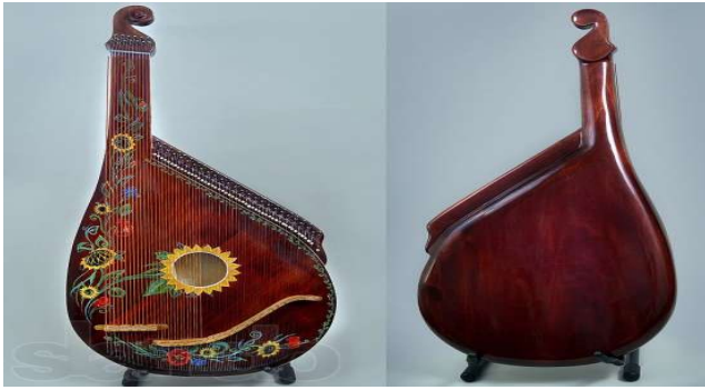
Кобза Торбан Домра Бандура