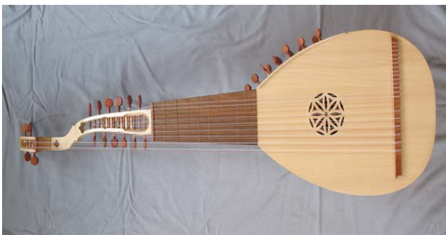
Кобза Бандура Торбан Домра