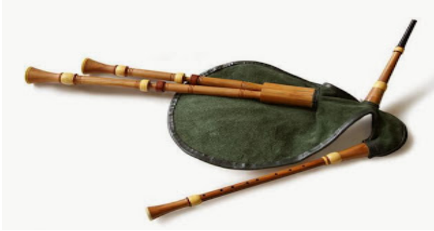
Воинка Лігавя Зозулка Сопілка