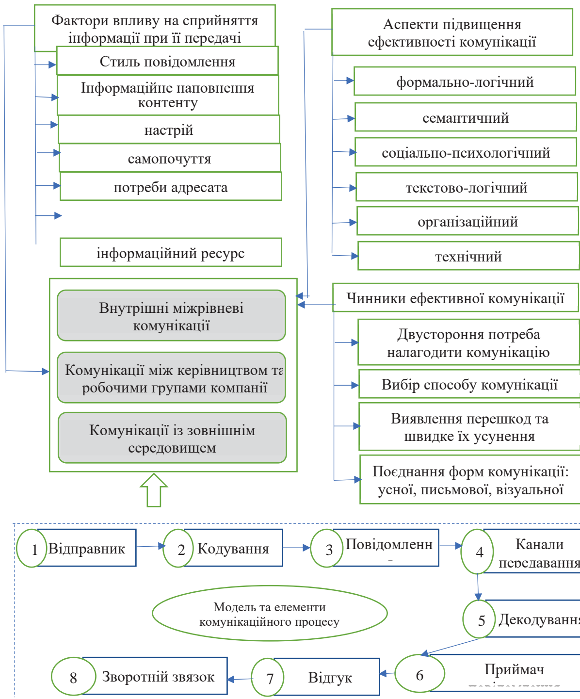
Рис. 1. Сучасна модель та елементи комунікаційного процесу у підприємствах сфери гостинності й чинники впливу на її ефективність