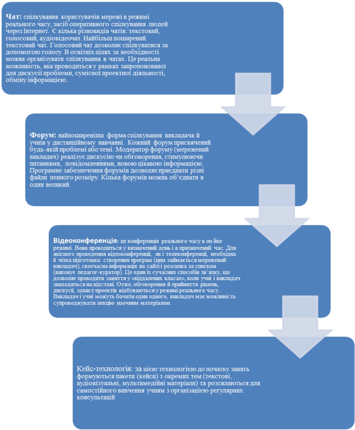
Рис.1. Огляд ресурсів, які сприяють використанню інформаційних технологій у процесі вивчення іноземної мови; складено автором

Дистанційне навчання у процесі вивчення іноземних мов може передбачати такі форми здійснення самостійної пошукової діяльності за використання таких ресурсів та засобів, як: