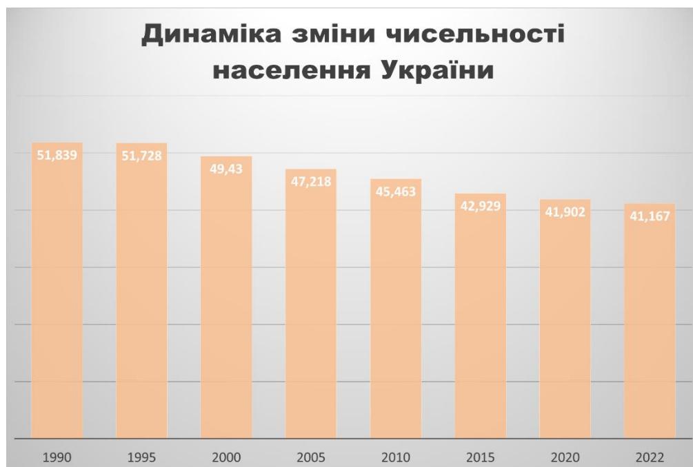
Рис 1. Динаміка зміни чисельності населення України

Тема “Розселення населення” передбачає формування у здобувачів загальної середньої освіти знань про густоту населення, міські агломерації, типи сільських поселень, тощо. Саме в цій темі можна застосувати картографічний метод роботи з учнями [8]. За картою «Густота населення», можна охарактеризувати міста мільйонери, визначити густоту населення в областях України, побудувавши діаграми та графіки за статистичною інформацією. Проблемно-пошукові завдання стосуються причин нерівномірності розселення, відмінностей у розселенні між містами і селами населення [3, 8].