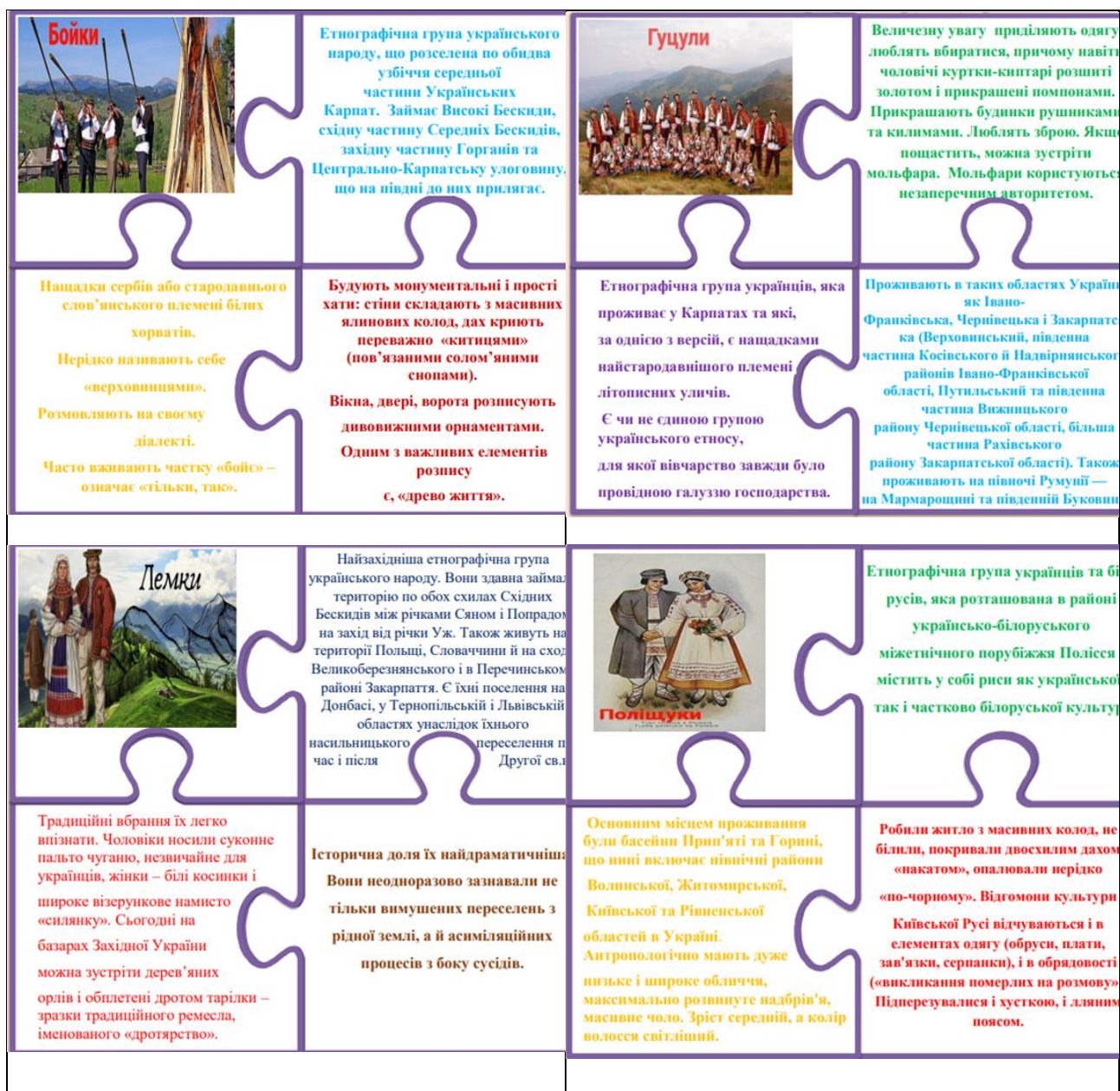
Рис. 2 «Етнічний пазл»

Тема зайнятості населення розкривається через ознайомлення з віковими групами та їх участю у трудовій діяльності, секторальною зайнятістю, проблемою безробіття [3].