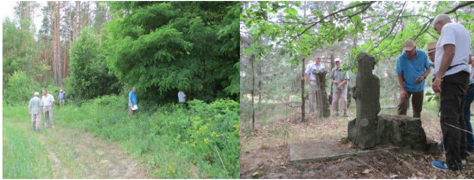
Рис 3. Фото з експедиції німецької делегації на території громади за участі Грабовського Юрія

Свій вклад в дослідження громади, зокрема Довбишанського округу, що є частиною Пулинського району, робить Сологуб Олег. Його діяльність спрямована на дослідження життя етнічних груп, зокрема польського народу, що проживали на території громади в період Другої світової війни і до тепер. Співпрацюючи з закордонною пресою, брав участь у написанні статті для польського видання. (Рис 4)