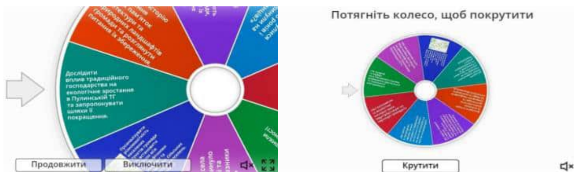
Рис. 5. Колесо фортуни. Розподіл тем для краєзнавчих досліджень

Розпочинаючи з 6 класу, краєзнавчий принцип є невід’ємною частиною вивчення географії. Використовуючи різні методи, вчителі здатні зацікавити учнів до подальшого вивчення географії та рідного краю. Вивчення свого краю, учні можуть розпочати з спостережень за навколишнім середовищем, проводячи описи за певним планом. Прикладом може бути заповнення календаря погоди на певний місяць. В подальших курсах, можна використовувати розробку проєктів, використовуючи краєзнавчі матеріали. Розподіл тем краєзнавчих досліджень може бути у вигляді Колеса фортуни у застосунку wordwall (Рис 5).