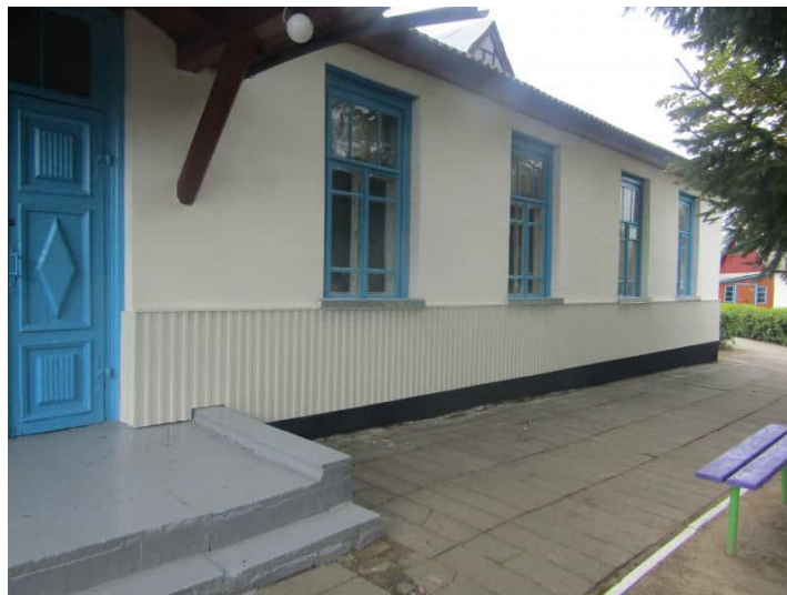
Рис. 2. Вхід до історико-краєзнавчого музею на базі Очеретянської школи