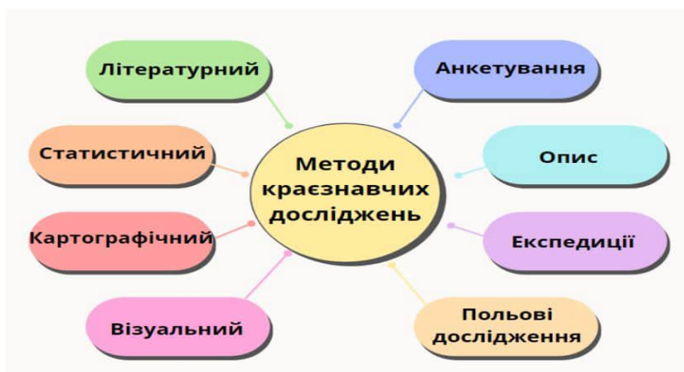
Рис. 1. Методи краєзнавчих досліджень

Короткий виклад матеріалу. Найхарактернішими рисами краєзнавства є різнобічність та багатогранність. Для детального вивчення свого краю, необхідний комплексний підхід, що включає різні методи краєзнавчих досліджень (Рис 1).