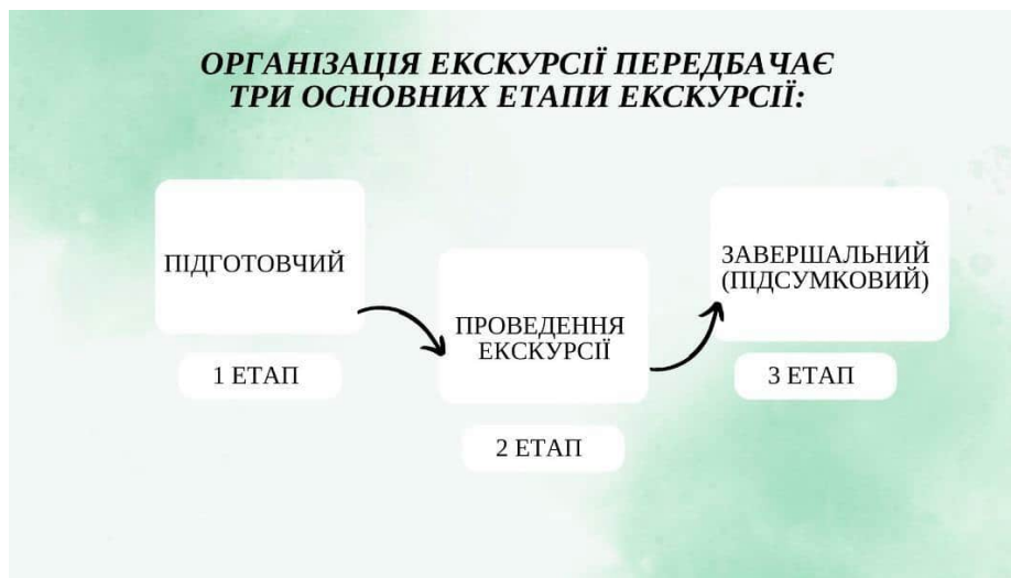
Рис. 2. Основні етапи проведення екскурсії

Успішне проведення краєзнавчої екскурсії потребує ретельної підготовки та організації з боку вчителя. Науковці виділяють три основні етапи цього процесу: підготовчий, власне проведення екскурсії та підсумковий (рис. 2) [2].