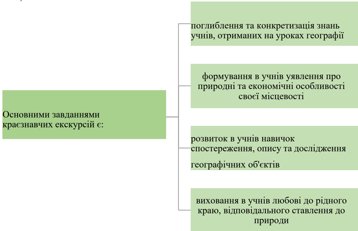
Рис. 1. Основні завдання краєзнавчих екскурсій

Як зазначають науковці, краєзнавча екскурсія являє собою колективне відвідування природних, промислових, історичних об'єктів з навчальною чи пізнавальною метою [2]. Під час таких екскурсій учні не лише спостерігають за довкіллям, а й активно досліджують його, збирають краєзнавчий матеріал (рис. 1).