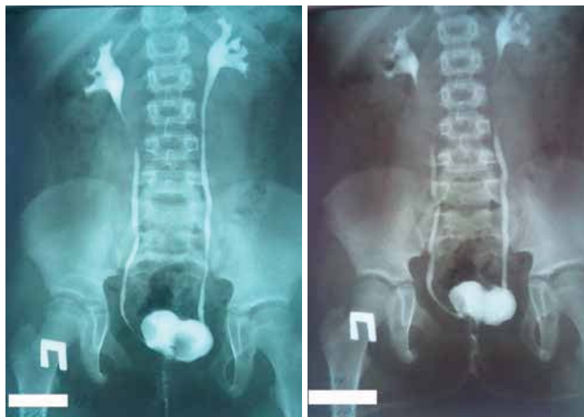
Рис. 1. Мікційна цистографія (2016 р.)

ного каменя збільшення цистопластик різними відділами кишечника швидко поширювалося і змінило тактику лікування дітей та дорослих пацієнтів із порушенням функції сечового міхура [12].