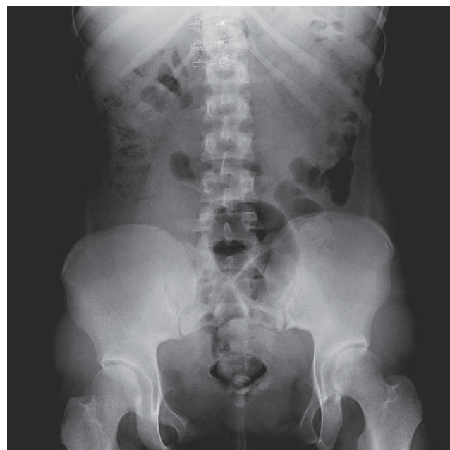
Рис. 3. Оглядова рентгенографія сечового міхура (2022 р.)

У квітні 2017 року пацієнтку госпіталізовано з діагнозом «Вроджена вада розвитку сечовидільної системи: екстрофія сечового міхура (стан після пластики); мікроцист; двобічний міхурово-сечовідний рефлюкс; стійке повне нетримання сечі; вторинний