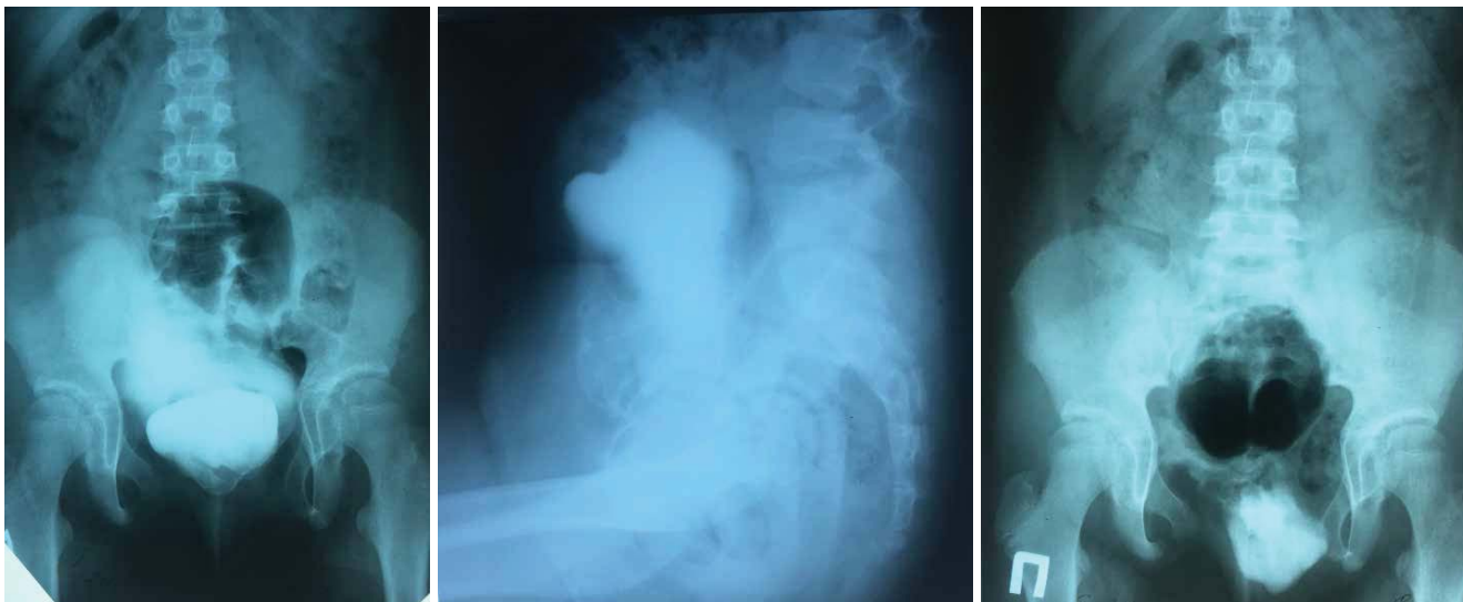
Рис. 2. Мікційна цистографія (2018 р.)

го сечового міхура. Найбільш перспективним, на нашу думку, є формування міхура за допомогою робот-асистованих технологій [2,4,10,11,23].