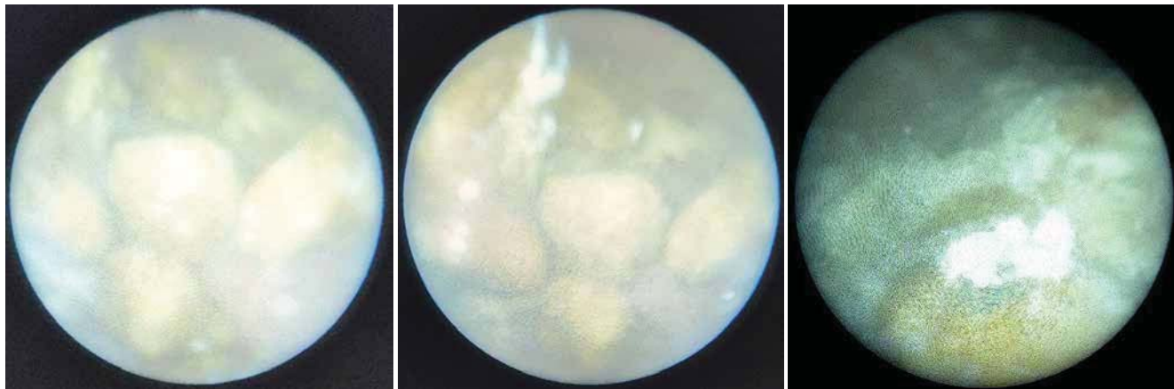
Рис. 4. Цистоскопія – конкременти в аугментованому сечовому міхурі (2022 р.)