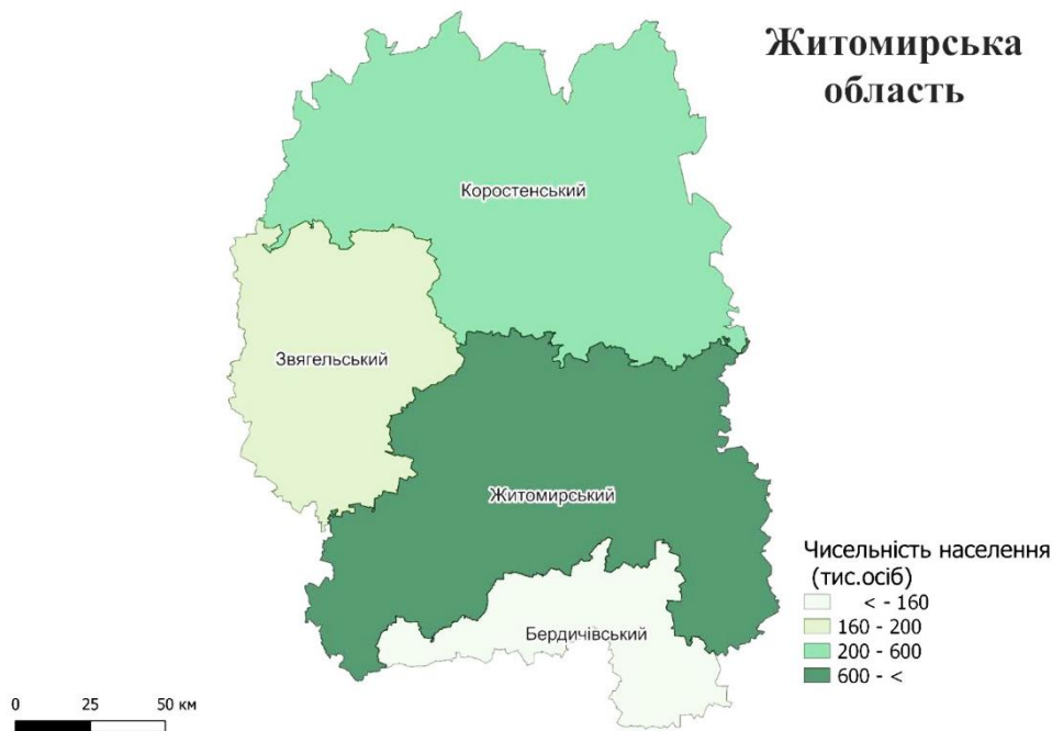
Рис.1. Чисельності наявного населення Житомирщини за районами за даними 2013-2022 рр. [1]

Структура демографічних показників в Житомирській області суттєво не відрізняється від структури в Україні, смертність втричі перевищує народжуваність. Коефіцієнт смертності населення в межах значення для області становить 1763,8 осіб на 100 тис. населення.