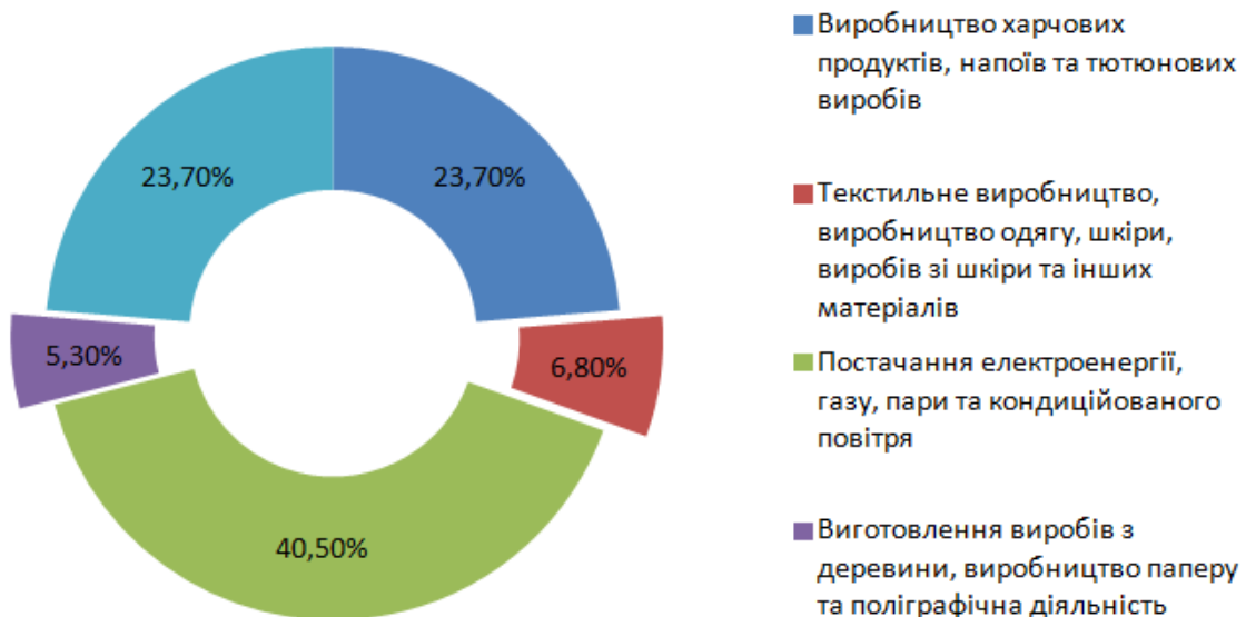
Мал. 1. Розподіл обсягу промислової продукції за галузями [6]

За період у 9 місяців 2022 року продаж промислової продукції у порівнянні з таким же періодом у 2021 році виросли на 15,3%. При цьому її частка у загальному обсязі продажу продукції міста збереглася на рівні 24,0%.