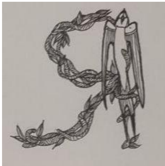
Рис. 3. Літера «Я»

Для виконання своєї роботи ми обрали папір для пастелі формату А1, оскільки саме цей матеріал має достатню міцність та щільність, щоб уникнути деформацій та розірвання при малюванні. А також він добре вбирає в себе туш, що робить його кращим для використання.