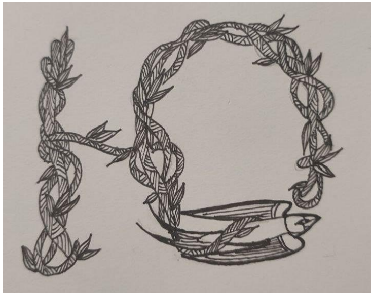
Рис. 2. Літера «Ю»

На завершення роботи над авторським шрифтом кожна літера промальовувалась тушшю. Приклади літер представлено на рис. 2. та рис. 3.