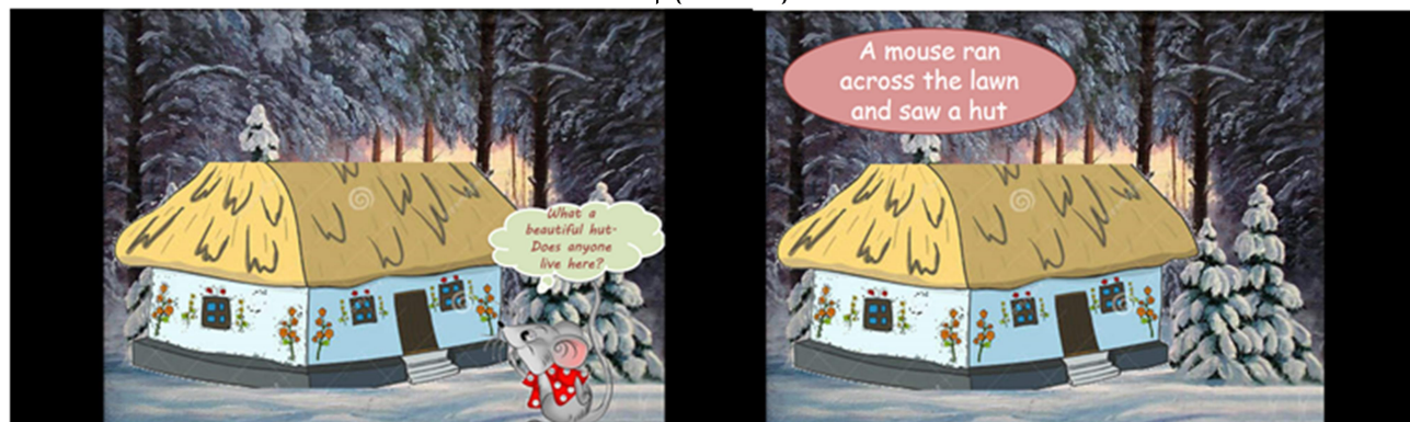
Fig. 2. Illustrative material on the topic "Animals"

A) Look at the picture and guess what fairy tale we are going to retell today (Рис. 2)