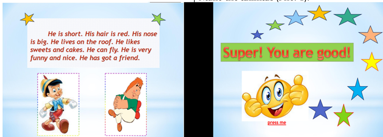
Fig. 1. Illustrative material on the topic "Appearance"

Завдання: Do the test. Look at the pictures of people and read their description. Find the right person and click on him. Name the animals (Рис. 1).